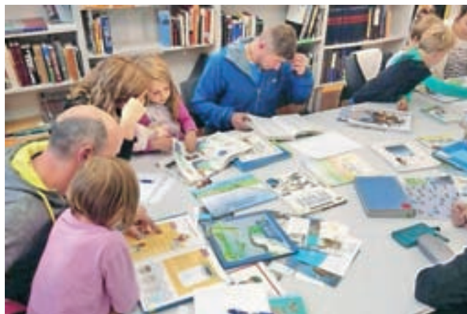
Delavnice Čudežna slatina

Prvi korak pri spodbujanju in razvoju je, da starše seznanimo s pomenom in načini razvijanja družinske pismenosti. Pri tem se poudarja vloga spodbudnega okolja ter pomen skupnega branja, pripovedovanja in pogovora o knjigi. In najpomembnejše: tudi s svojim lastnim zgledom in odnosom do branja in knjig.