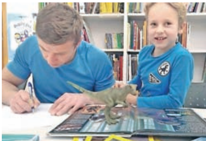
Delavnice z dinosavri

V Sloveniji imamo tudi Nacionalno strategijo za razvoj pismenosti, kjer je pismenost opredeljena kot trajno razvijajoča se zmožnost posameznika, da uporablja družbeno dogovorjene sisteme simbolov za sprejemanje, razumevanje, tvorjenje in uporabo besedil za življenje v družini, šoli, na delovnem mestu in v družbi.